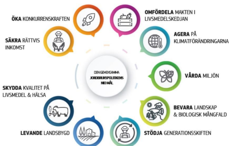
Figur 1. De nio målen i EU:s gemensamma jordbrukspolitik.

https://agriculture.ec.europa.eu/common-agricultural-policy/cap-overview/cap-2023-27/key-policy-objectives-cap-2023-27_sv