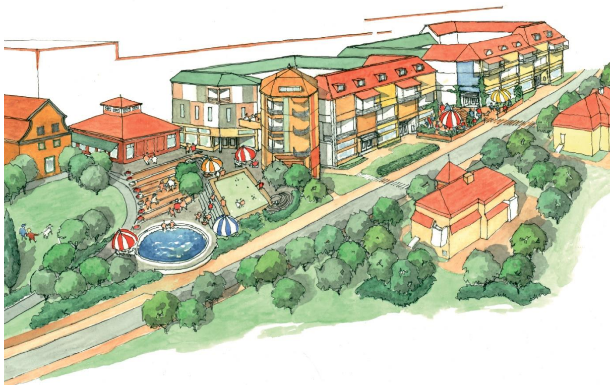
Figur 1 Visionsbild av reviderat förslag med Vasaplatsen i förgrunden. Tak i sedum (gröna växter) och i takpannor som går i stil med villastaden. Färgsättningen är ljus och positiv i linje med villastadens färger. Illustration: Småstaden Synergi AB

Bilden visar Vasaplatsen och den nya bebyggelsen längs Lejonvägen. Genom den nya utformningen vi föreslår skapas en trivsamt miljö på Vasaplatsen där