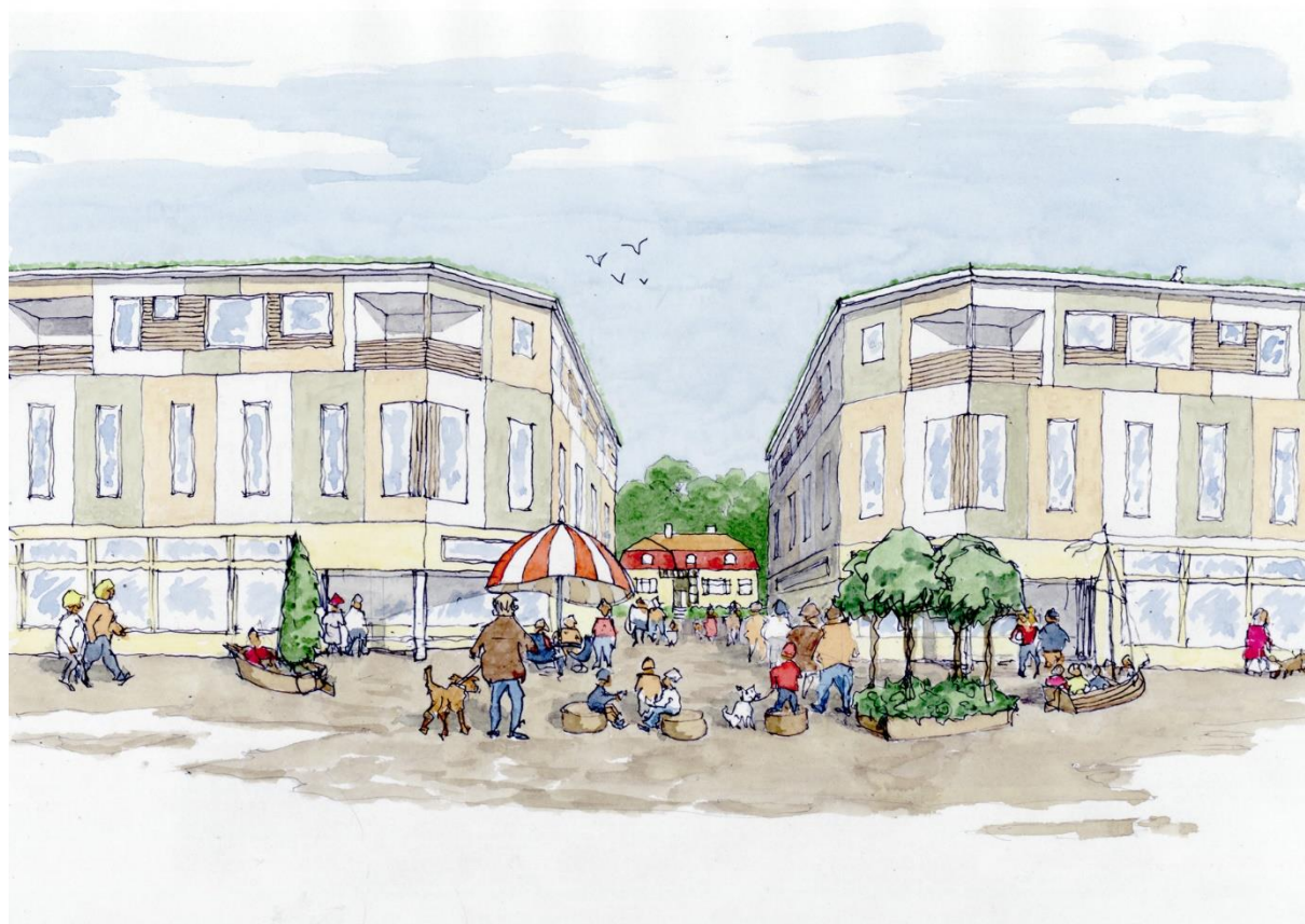
Figur 2 Visionsbild med Systembolaget i ryggen. Genom att ta bort samrådsförslagets otillgängliga trappa, skära av hörnen på byggnaderna och sänka våningstalet med 1-2 våningar så skapas en trivsam gågata med minitorg och en naturlig koppling mellan villastaden och nuvarande Centrum.