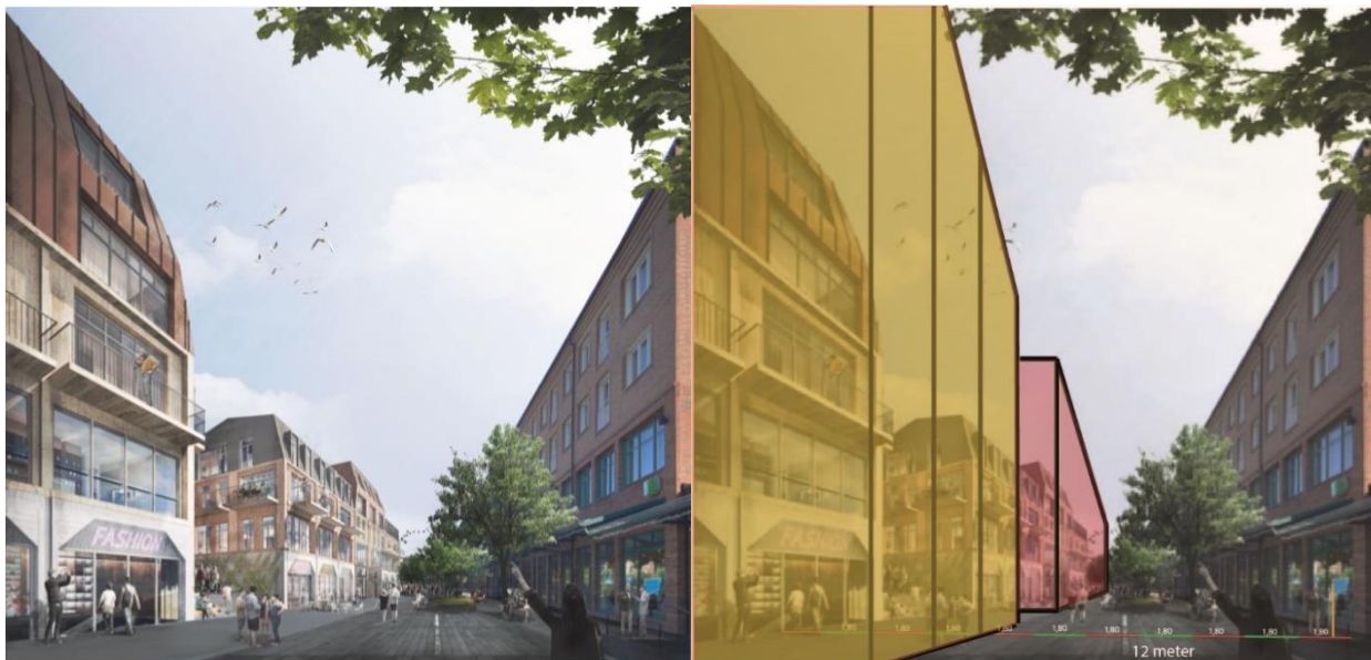
Jämförelse mellan samrådets illustration där bilden visar en drygt 20 m bred gata och schematisk bild över husens mer verkliga placering utifrån att gatan får en bredd på 12 meter som stipuleras i plankartan.

Denna missvisande illustration gör att volymen på nybyggnationen ser mindre ut än den kommer att göra i verkligheten. Det är oroväckande att Lidingöbornas ställningstaganden ska baseras på missvisande bilder. Centerpartiets slutsats är att höjden på byggnaderna måste minska samt att hörnen på husen skäras av för att skapa en större luftighet. Då skapas platsbildningar som kan inredas så att en trivsam gatumiljö med småstadskänsla på Friggavägen skapas. Dessutom innebär en lägre våningshöjd att förändringarna blir mer acceptabla för de som redan bor i Oden 24.