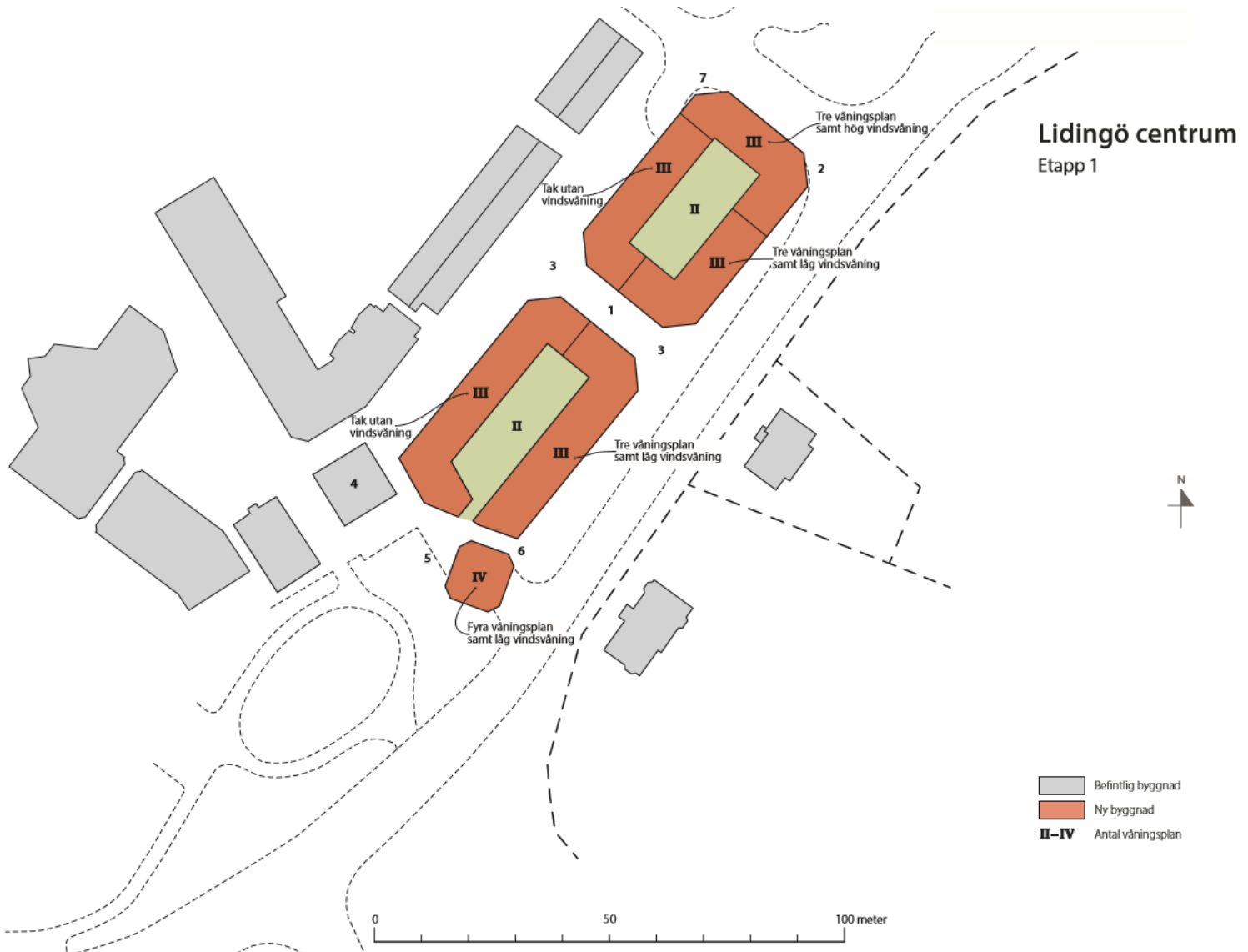
Plankarta för reviderat förslag för Lidingö Centrum etapp 1. Planillustration: Småstaden Synergi AB

Förändringar med markering på plankartan: