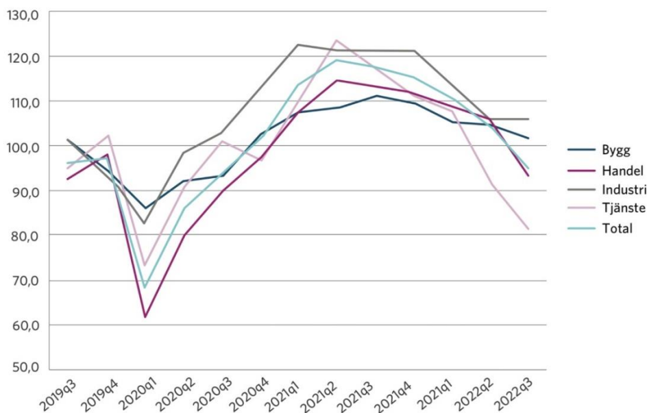
Figur 1. Konfidensindikatorn för näringslivet i Västerbotten har försvagats under 2022 i linje med övriga län och riket. Konfidensindikatorn tas fram genom en företagsenkät och mäter nuläget i näringslivet samt hur företagen ser på den närmaste framtiden (källa Norrlandsfondens konjunkturbarometer nov 2022)

Umeås näringsliv karaktäriseras av en väldigt stor branschbredd och en diversifiering med en tredjedel anställda inom tillverkande industri, företagstjänster samt platstjänster. Det har tidigare inneburit att Umeå klarat konjunktursvängningar betydligt bättre än de flesta andra platser. Till det kommer också det stora inslaget av offentliga arbetstillfällen som är mindre känsliga för skiftningar i konjunkturen.