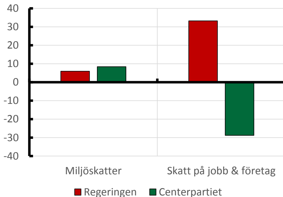
Diagram: Skatteväxling regeringen och Centerpartiet

Not: Miljöskattehöjningar inkl regeringens förslag och förändringar av jobbskatter exkl regeringens förslag.