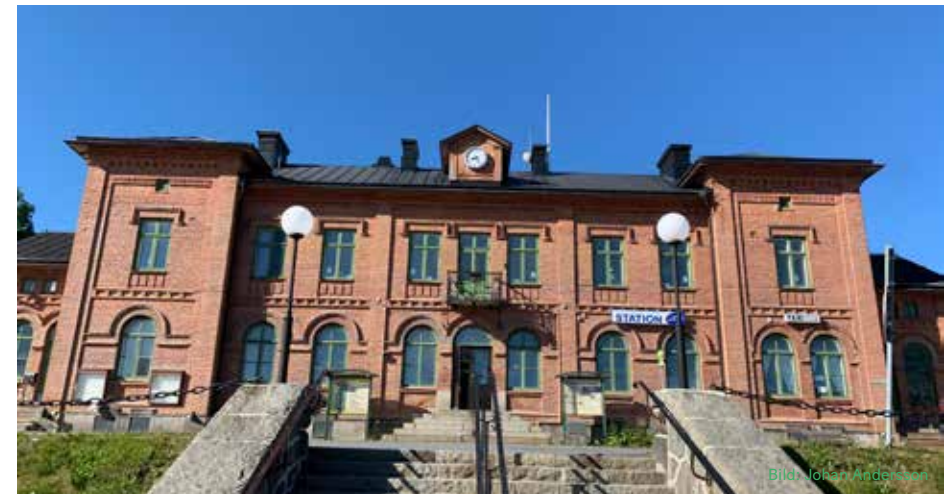
Centerpartiet vill att persontågen åter skall stanna i Sollefteå

En rapport visar på att detta är möjligt i närtid, det som krävs nu är den politiska viljan. Centerpartiet prioriterar denna viktiga utvecklingsfråga för vår kommun.