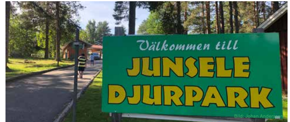
Junsele djurpark drar många besökare