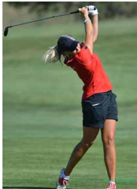
Golfbanan i Österforse är en av Norrlands förnämsta.

campingar, fiske, bad, unika sevärdheter, spännande älvdalar, djupa skogar och ett unikt niplandskap. Föreningar, byalag och entreprenörer uppmuntras att utveckla turismen. Vi vill ha fler gästanter och ännu nöjdare besökare i hela kommunen.