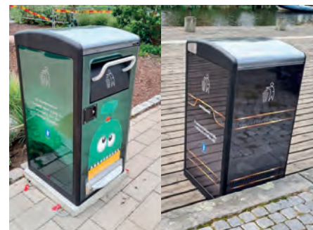
Smarta papperskorgar finns sedan tidigare även i ibland annat Varberg och Halmstad.