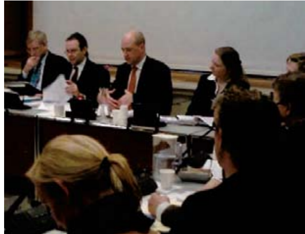
Utfrågning i EU-nämnden av Fredrik Reinfeldt, Anders Borg och Carl Bildt.

Jobbskatteavdraget går endast till dem som arbetar och är en viktig faktor för att få fler i arbete och öka motivationen till arbete.