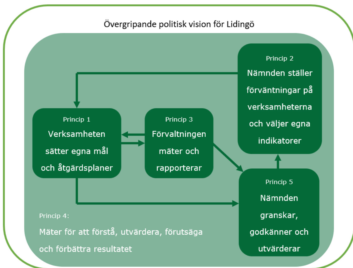
Figur 1 förevisar Centerpartiets förslag till styrmodell

Princip 5: Styrningen av den politiska inriktningen säkras genom att nämnderna godkänner verksamheternas mätbara mål, granskar verksamheternas åtgärdsplaner och utvärderar mätresultat.