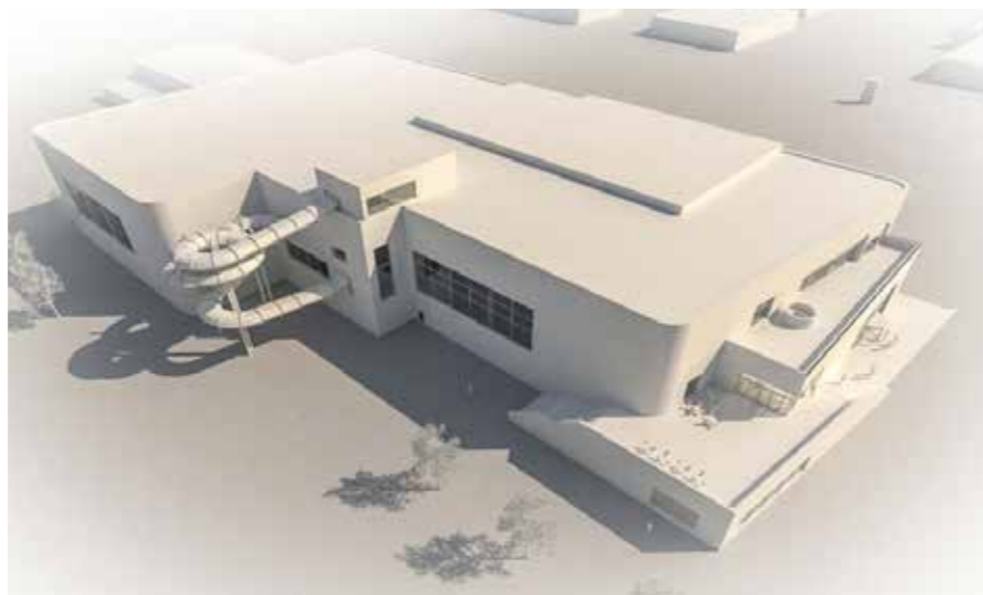
Den nya simhallen rymmer en bassäng på 50 x 25 meter, vilket ger både invånare och simklubben goda möjligheter framöver.

På senaste fullmäktigemötet togs ett för många av oss efterlängtat beslut! Nämligen beslutet att anslå 426 miljoner kronor i investeringsbudgeten till en ny simhall samt ytterligare 100 miljoner till infrastruktur och park intill simhallen. Denna investering nämns som Kungsbacka kommuns hittills största enskilda investering!