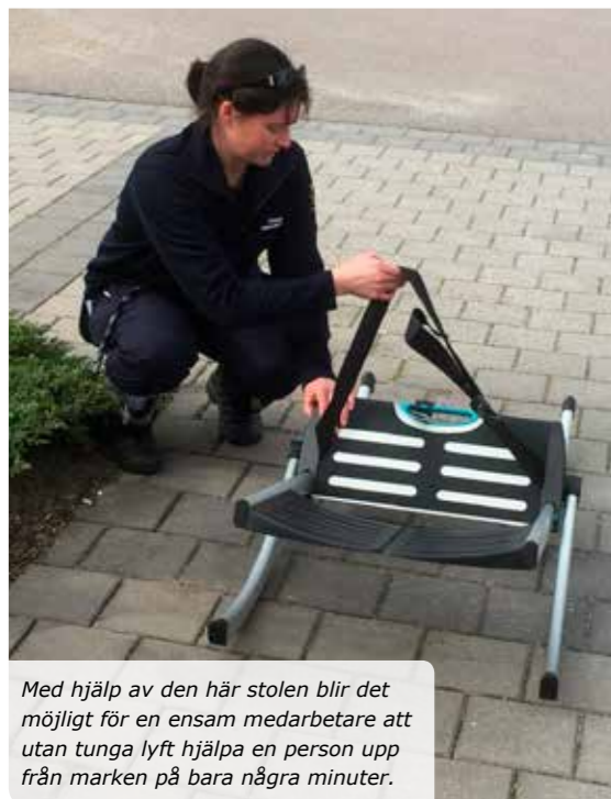
Med hjälp av den här stolen blir det möjligt för en ensam medarbetare att utan tunga lyft hjälpa en person upp från marken på bara några minuter.

Lägligt nog kom just ett av teamen in när vi var på stationen. Vi fick då möjlighet att se ett annat av deras nya hjälpmedel. Hur kan en ensam medarbetare hjälpa en person upp från marken? Med en sinnrik monteringsbar stol fick vi se hur man utan tunga lyft får upp personen i sittande/stående ställning på några minuter.