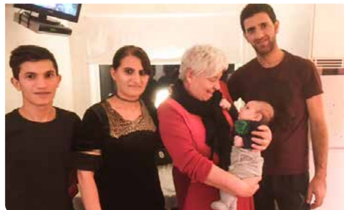
Vi har nu

lyckats lösa boendet oftast p.g.a. ett mycket trubbigt regelsystem och dålig samordning och dessutom en stor brist på bostäder.